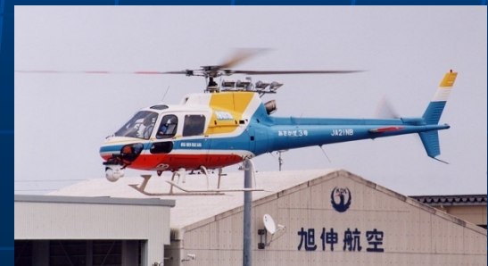
長野臨時場外離着陸場 (通称長野ヘリポート)